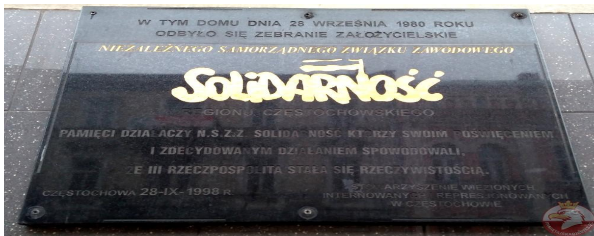
Wybór tych właśnie miejsc pamięci nie był przypadkowy, bowiem w naszej szkole funkcjonuje Izba Pamięci PRL poświęcona NSZZ „Solidarności” i jej działalności.